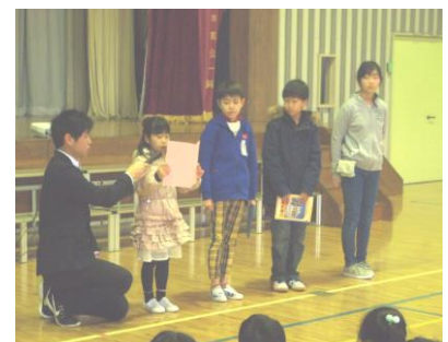
＜児童の発表の様子＞