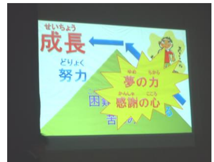
＜校長講話のスライド＞