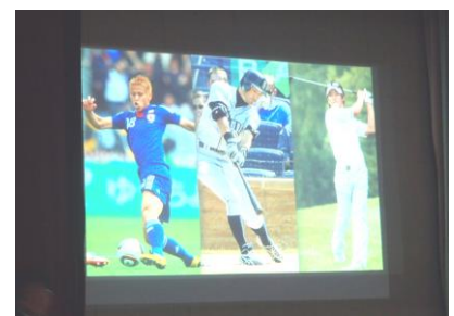
＜校長講話のスライド＞